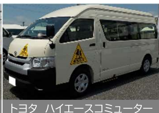
トヨタ ハイエースコミューター

実際に使用されている車両にて設置および動作確認を行った上で内閣府の認可を得ています。